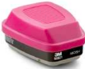
3M® Cartucho Dual para Vapores Orgánicos y partículas P100, 60921