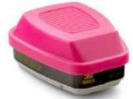
3M® Cartucho Dual p/ Formaldehído, Vapores Org y partículas P100, 60925