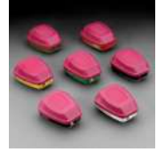
Cartuchos y filtros para Respiradores de Completa y Media Pieza Facial Series 6000, 7500, 7800S y FF-400 de 3M®