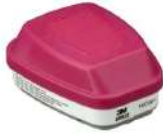
3M® Cartucho Dual para Gases Ácidos y partículas P100 , 60922