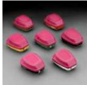
Cartuchos y filtros para Respiradores de Completa y Media Pieza Facial Series 6000, 7500, 7800S y FF-400 de 3M®