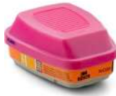
3M® Cartucho Dual p/ Vapores Mercurio, Gases Cloro y partíc P100, 60929S