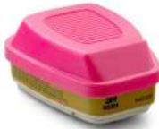
3M® Cartucho Dual para Multigases, Vapores y partículas P100, 60926