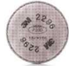
3M® Filtro avanzado, P100 contra olores molestos p/ gases ácidos, 2296