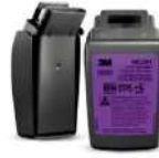
3M™ Secure Click™ Filtro de Partículas con Carcasa Dura P100 D9093CB, con Alivio de Niveles Molestos de Gases Ácidos, 144 piezas por paquete